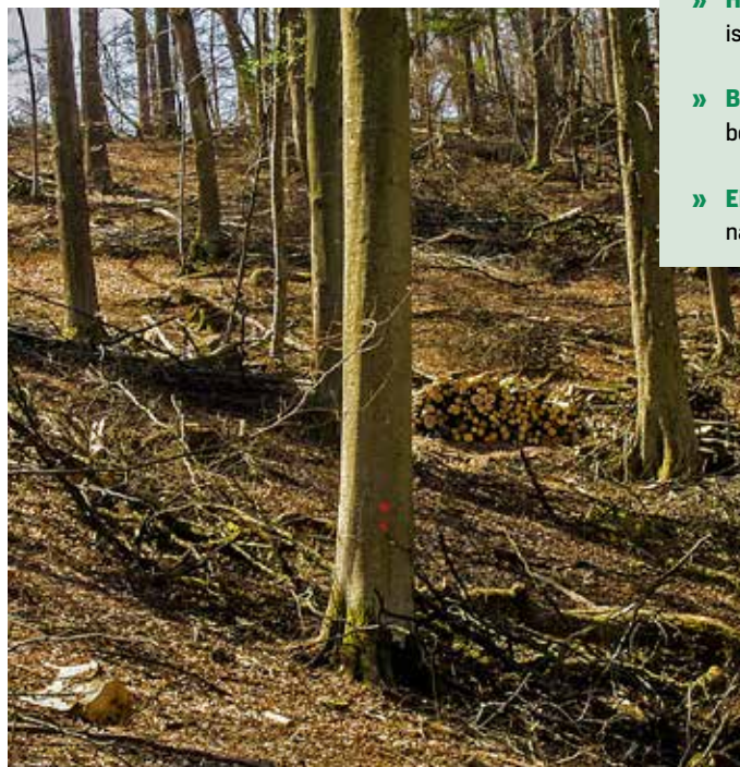
Abb. 1: Brennholz aus einer Durchforstung ist CO 2 -neutral, der geerntete Kohlenstoff ist auf Landschaftsniveau bereits wieder im Bestand gebunden, bevor das Holz verbrannt ist, eine Kohlenstoffschuld existiert nicht. Der Kohlenstoffvorrat im Waldökosystem wird durch die Brennholznutzung nicht geschmälert, das Wachstum des Buchenbestandes wird durch Lichteinfall beschleunigt und auf weniger Bäume konzentriert, dadurch steigen die Chancen einer stofflichen Substitution mit deutlichen Klimavorteilen.

nicht. Denn Wälder sind wegen ihrer Langlebigkeit und Ortsgebundenheit klimasensitiv und deshalb in Zeiten des Klimawandels labile C-Speicher [12, 24, 15, 25, 3, 26, 27]. Die Fragilität von Europas Wäldern wird sich im Klimawandel drastisch zeigen [28, 29, 3]. Die Anreicherung von noch mehr Totholz würde in Dürreperioden das Risiko gewaltiger CO 2 -Emissionen durch Brände [29] dramatisch steigen lassen. Demgegenüber stellt die Bindung von C